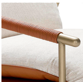
Bordino in ecopelle // Eco-leather piping