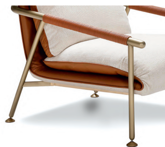
Struttura in metallo // Metal structure